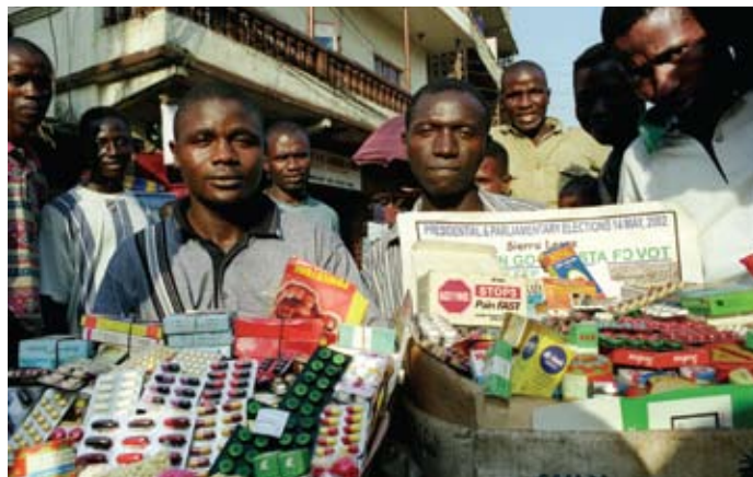
A Freetown, Sierra Leone, des marchands vendent au marché divers médicaments soumis ou non à prescription médicale. Nombreux sont sortis de leur boîte d'origine ou sont périmés.

Dans le même temps, la recherche internationale réaffirme au travers d'une littérature de plus en plus abondante que, malgré les problèmes très sérieux rencontrés dans de nombreux pays, les services financés et fournis par l'Etat continuent de représenter le système de santé le plus performant et le plus équitable. Aucun pays d'Asie à faibles ou moyens revenus n'est parvenu à proposer un accès universel ou quasi universel aux soins de santé sans compter uniquement, ou principalement, sur une offre de services publics financée par les impôts. L'augmentation de l'offre publique a entraîné d'énormes progrès en dépit de la faiblesse des revenus. Une femme du Sri Lanka, par exemple, peut s'attendre aujourd'hui à vivre aussi longtemps qu'une femme allemande, malgré un revenu dix fois inférieur. Si elle enfante, elle a 96 pour cent de chances d'être assistée par du personnel de santé qualifié.