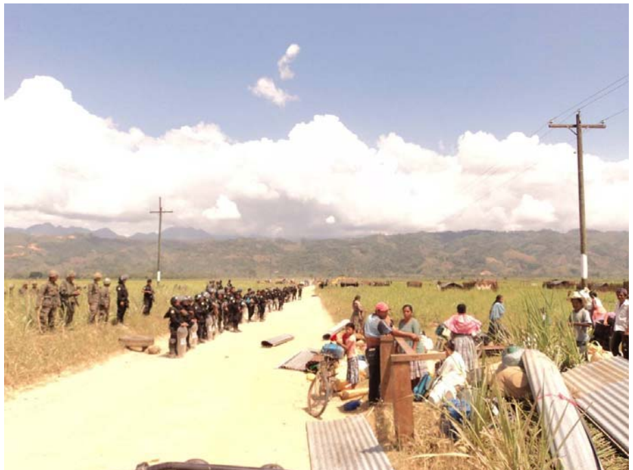
Miralvalle, vallée du Polochic, Guatemala, 15 mars 2011. La communauté a été expulsée, les maisons et les cultures détruites

La nouvelle vague de transactions foncières ne correspond pas aux nouveaux investissements agricoles que des millions de personnes attendaient. Les plus démunis sont les plus durement touchés par l'intensification de la concurrence pour les terres. Il ressort des études d'Oxfam que les habitants sont invariablement perdants face aux élites locales et aux investisseurs nationaux ou étrangers, faute de disposer du pouvoir nécessaire pour faire valoir leurs droits de façon efficace ou pour défendre et promouvoir leurs intérêts. Les entreprises et les gouvernements doivent de toute urgence adopter des mesures visant à améliorer les droits fonciers des personnes qui vivent en situation de pauvreté. Les relations de pouvoir entre investisseurs et communautés locales doivent aussi évoluer si l'on veut que les investissements contribuent à la sécurité alimentaire et aux moyens de subsistance des communautés locales au lieu de leur porter préjudice.