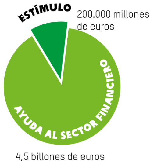
Gráfico 1: El Plan de Recuperación Económica de la UE frente a las ayudas al sector financiero 8

En 2010, muchos gobiernos europeos pusieron fin a sus programas de estímulo y adoptaron diversos paquetes de medidas de austeridad. Algunos, como Grecia, España, Irlanda y Portugal, se vieron obligados a adoptar políticas de austeridad en virtud de los acuerdos de rescate establecidos con el Banco Central Europeo, la Comisión Europea y el Fondo Monetario Internacional (FMI). Otros, como el Reino Unido, han elegido libremente estas políticas porque piensan que la austeridad es la mejor manera de acabar con el elevado nivel de deuda pública y el déficit presupuestario.