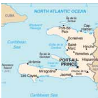
Port-au-Prince en de gebieden waar Oxfam werkt.