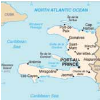
Potòprens ak lòt zòn an Ayiti kote Oxfam ap travay.